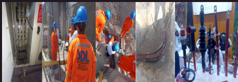
Detección, reparación de terminales y empalmes de media tensión.