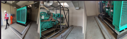
Mantenimiento de grupos electrógenos.